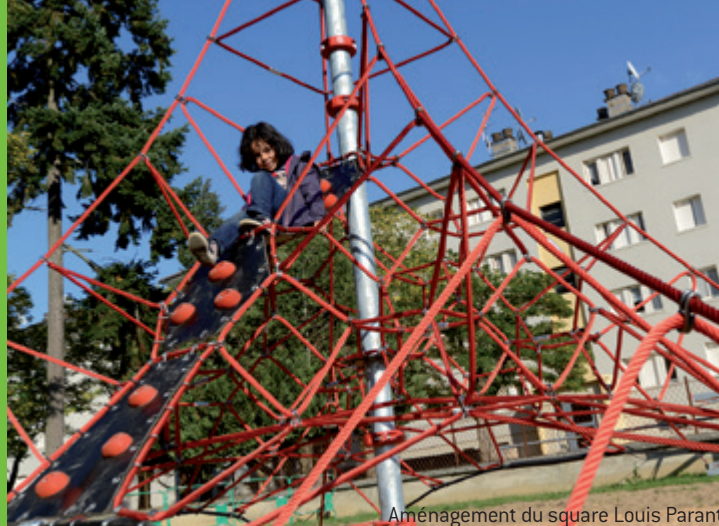
Aménagement du square Louis Parant

Vous avez jusqu'au 25 février 2018 pour candidater